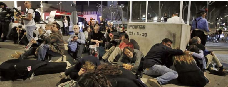
حمله بالستیک یمن به فرودگاه بن گوریون تل آویو

حمله زمینی به لبنان کلید می خورد؟ اکنون در سرزمین های اشغالی صحبت از ماموریت ارتش برای ممانعت از انتقال سلاح ایران به لبنان از طریق سوریه است. در سوریه سه کریدور اصلی و مرکزی برای انتقال سلاح به حزب ا... وجود دارد: بوکمال، حلب و دمشق. بنابر این انتظار می رود در روزهای آتی حملات صهیونیست ها به مرکز کریدورهای فوق وزیر ساخت های آن ها مانند از کار انداختن فرودگاه های حلب و دمشق یا انهدام گذرگاه های مرزی سوریه و لبنان منتقل شود. حتی انهدام پل های روی رود لیتانی که شمال و جنوب را به یکدیگر متصل می کند نیز به عنوان بخشی از تشدید تنش انتظار می رود. به نوشته کانال مجلل، این موارد همگی مقدمات حمله زمینی است و دشمن سعی دارد راه های تنفس حزب ا... در جنوب لیتانی را یکی یکی قطع کند در حالی که آنچه پنهان است، بزرگ تر است. پیش بینی می شود حملات صهیونیست ها تا پایان هفته آینده به شدت در نقاط مختلف افزایش یافته و این همراه با کارزار جنگ روانی شبکه های خود فروخته عربی و لبنانی در اعراب مردم مقاومت خواهد بود. پیش بینی ها حاکی از این است که حملات ترکیبی دشمن تا هفته آینده تشدید خواهد شد تا مقاومت مجبور به پذیرش توافق هوکشتاین - لودریان شود. در غیر این صورت تجاوز زمینی کلید خواهد خورد. در این چند روز نتانیاهاو در آمریکا به دنبال خرید مشروعیت بین المللی برای اقدام زمینی و باج گیری از آمریکا برای تامین کامل تسلیحاتی در جنگ آتی است. نتانیاهاو علاقه دارد که تنش را تا ۱۵ آبان پله ای افزایش دهد تا ترامپ وارد کاخ سفید شده و او نیز احیا شود. مقاومت با توجه به شرایط، علاقه مند به حفظ فرسایش وزن ضربات در دناک تا ۱۵ آبان به اسرائیل است.