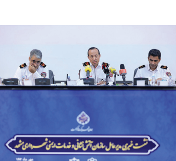
فرماندهی کل شهرستان مشهد

هستیم دفتر چه از مون زودتر در سایت جهاد دانشگاهی قرار بگیرد و شهروندان بتوانند ثبت نام کنند.