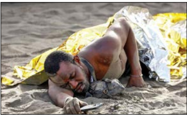
یک پناهنده چوپس از رسیدن به سواحل اسپانیا