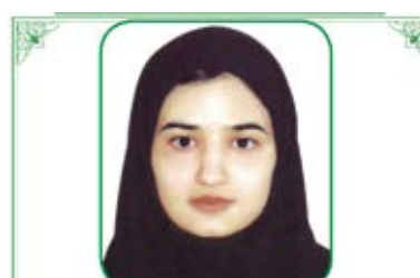
السه ناز نینمان (عدالتی) بودنت آنقدر قشنگ بود که رفتنت را بعد از ۲۱ سال باور نمی کنیم، عزیز آسمانی مان. خانواده داغدارت

استاد گرامی جناب آقای دکتر حکمت درگذشت مادر گرامیمان را خدمت جنابعالی و خانواده محترم تسلیت عرض نموده، از درگاه خداوند متعال برای آن مرحومه علو درجات و برای بازماندگان صبر مسئلت می نمایم. استاد گروه داخلی دانشگاه علوم پزشکی مشهد