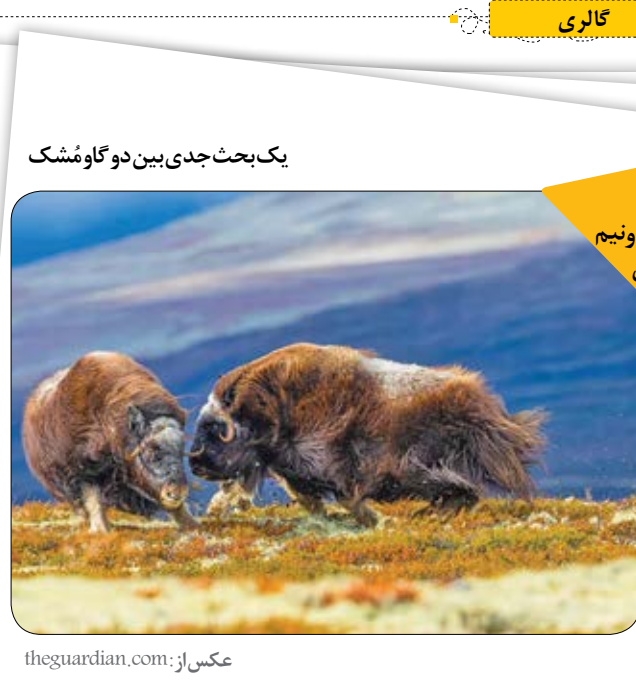
یک بحث جدی بین دو گاو شمشک

شماره پیامک ۳۰۰۹۹۹ شماره تلگرام ۵۷۶۴۳۹۴۰۹۳۵ تلفن تجربه ۰۵۱۳۷۳۴۰۰۰