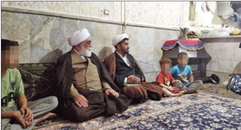
۳ روایت در شب عید قربان همراه با تولیت آستان قدس رضوی