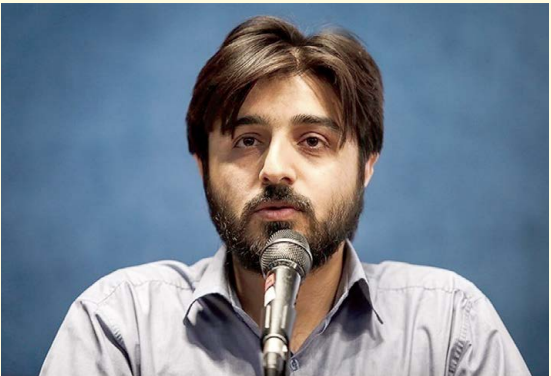
شعری از محمد مهدی سیار در ستایش «سید مقاومت»