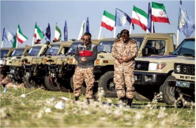
نماز پاسداران اهل سنت در رزمایش پیامبر اعظم ۱۹ نیروی زمینی سپاه