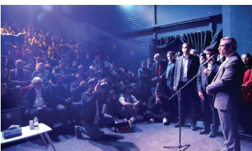
با حضور استاندار و رئیس شورای شهر انجام شد