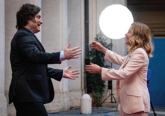
استقبال نخست وزیر ایتالیا از رئیس جمهوری آرژانتین در شهر رُم